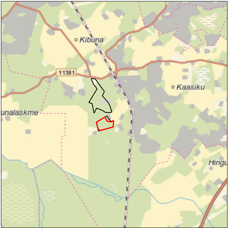
Kaardileht nr 6331 Keila